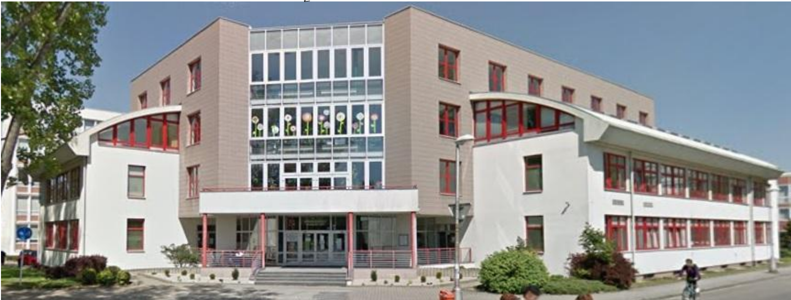
POHLED NA VSTUP DO OBJEKTU