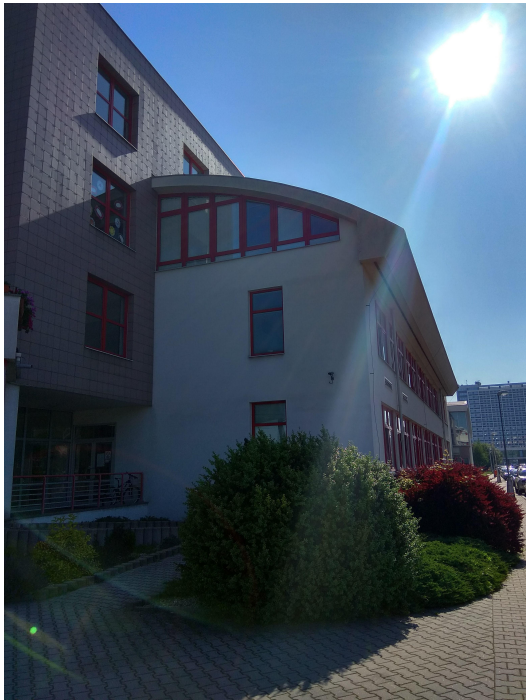
POHLED NA ŘEŠENOU STŘECHU- ČÁST B