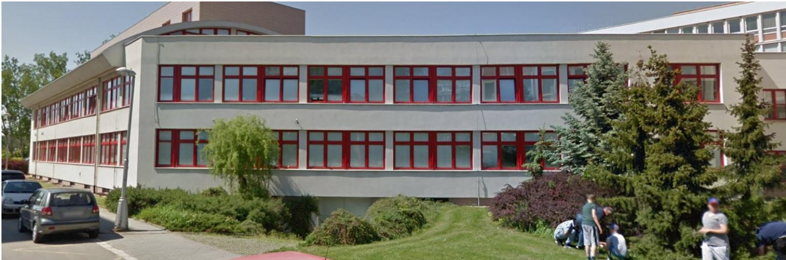
POHLED NA OBJEKT- VIDITELNÁ ŘEŠENÁ STŘECHA- ČÁST B