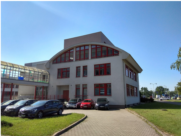
POHLED NA ŘEŠENOU STŘECHU- ČÁST A