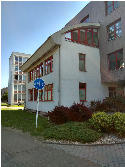
POHLED NA ŘEŠENOU STŘECHU- ČÁST A